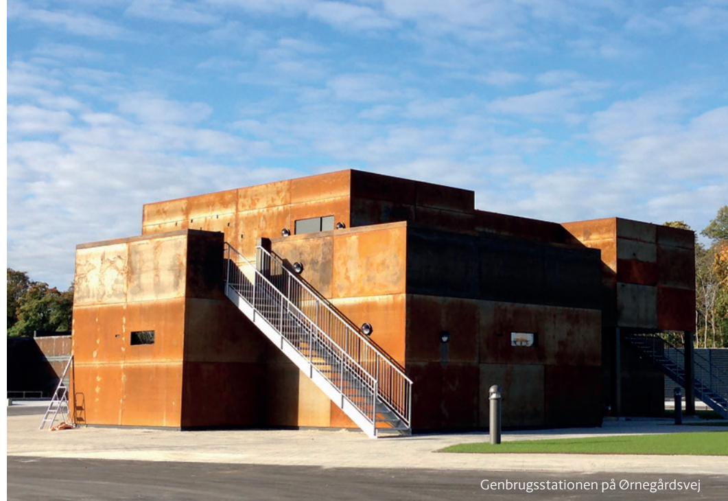
Genbrugsstationen på Ørnegårdsvej

Miljøaffald kan ved nogle ejendomme afleveres i Miljøskabe, mens andre steder har de Miljøbokse.